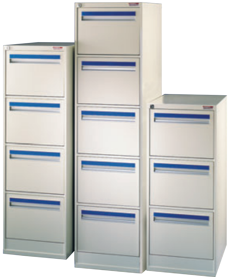
Norske arkivskap. Dybde 720 mm.

Norske skap er produsert i pulverlakkert stål med galvaniserte plater i bunnen.